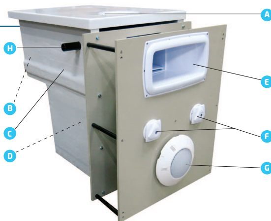
Schéma de principe d'un GS14 VT